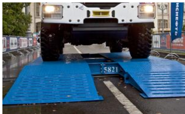
Рисунок 2 – Внешний вид весов автомобильных электронных «Фермер».